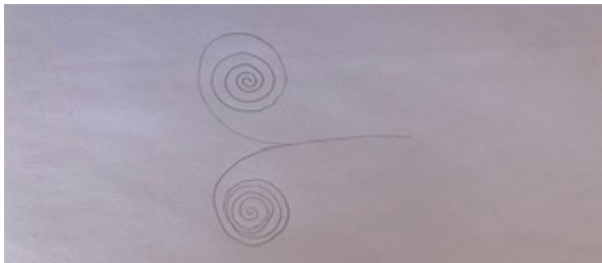
Figura 3: HIV: o indetectável, 2022.

Foi desafiador expressar o HIV, mas era preciso também expressar o HIV indetectável, já que esta é a condição em que se encontra Plutón, de ter o vírus, mas não o transmitir. Expressar o HIV indetectável-intransmissível (I=I) é uma decisão ético-política, uma dimensão fundamental do processo de produção de conhecimento, que não poderei desenvolver nesse artigo. Este processo presumiu um breve retorno a importância das células mais atingidas (os linfócitos T e da CD4+) nas infecções por HIV e construí o desenho "HIV: o indetectável" (Figura 3).