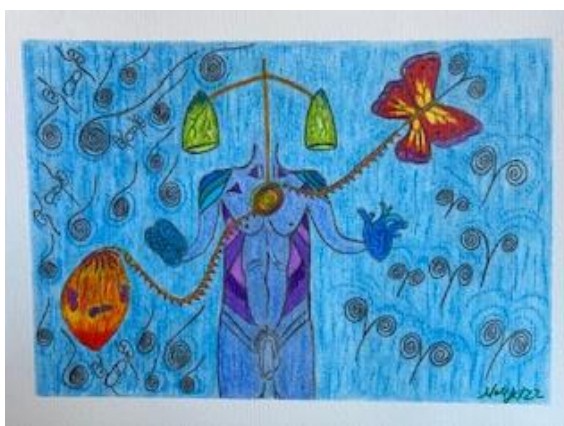
Figura 1 - “Sexualidad Atenta”: a ausência presente do invisível e PrEP, 2022.