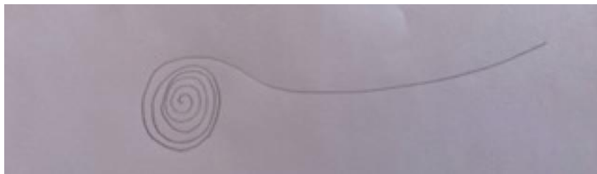
Figura 2: HIV: o invisível, 2022.

Então, uma ação de Plutón durante a entrevista, que observei tanto pelo movimento ativo no seu corpo quanto pela repetição, foi a inspiração. Todas as vezes que ele relatava algo sobre o que sentia com a infecção por HIV, a "falha da PrEP" e os anos de sexualidade atenta, ele colocava a mão no peito e rodava em torno do osso esterno. Este movimento ficou registrado em minha cabeça mais do que eu tinha consciência disso ao logo do nosso encontro. Quando, em casa, comecei a desenhar foi por aí que comecei (Figura 2).