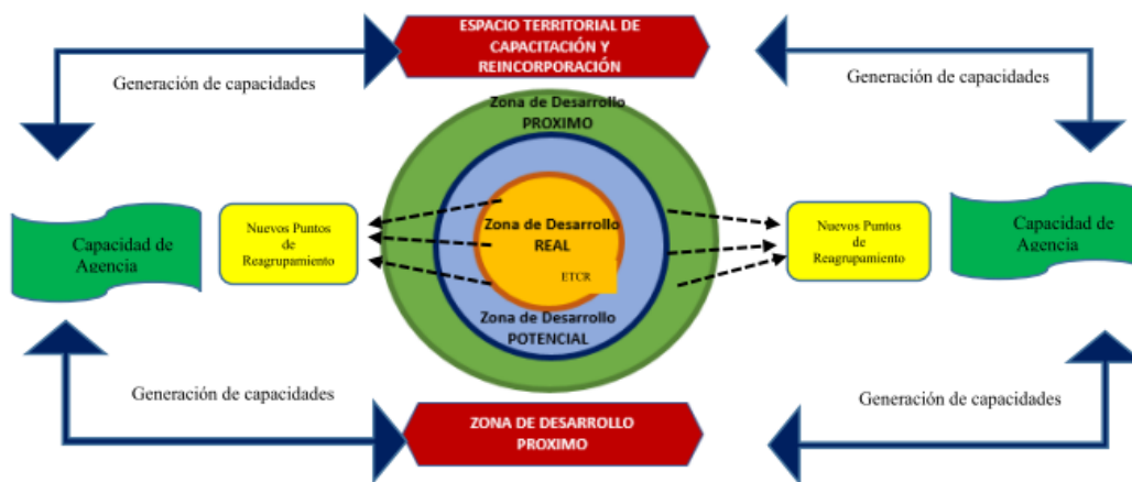
Figura 1: Metáfora Zona de Desarrollo Próximo.

Por lo anterior, la investigación y la producción del protocolo de intervención pretende establecer un proceso metodológico formativo que aporte a la capacidad de agencia para el desarrollo en los Espacios Territoriales de Capacitación y Reincorporación ETCR y las nuevas áreas de reincorporación grupal.